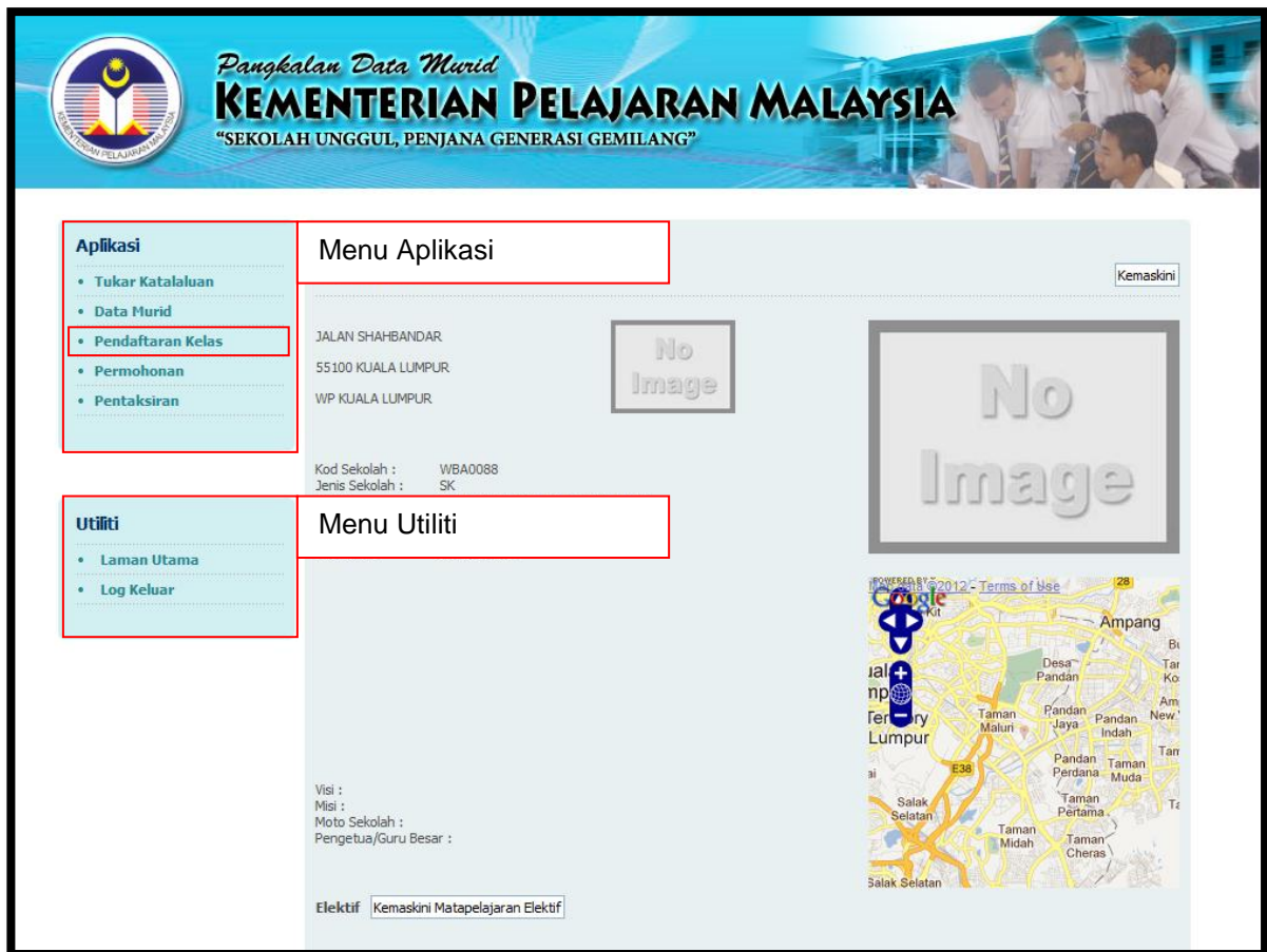
Paparan 1 : Paparan utama administrator sekolah

1.2. Portal akan memaparkan aplikasi atau kemudahan yang boleh diakses oleh administrator sekolah setelah log masuk berjaya seperti Paparan 1.