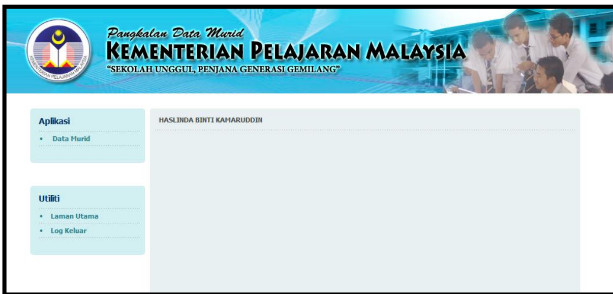
Paparan 9 : Paparan utama pengguna

1.2. Portal akan memaparkan aplikasi atau kemudahan yang boleh diakses oleh pengguna setelah log masuk berjaya seperti Paparan 9.