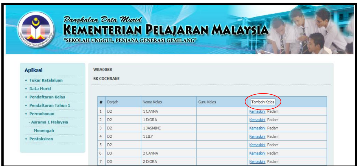
Paparan 2 : Senarai kelas yang telah didaftarkan

3.1. Klik pada Pendaftaran Kelas di menu Aplikasi (rujuk Paparan 1). Paparan 2 merupakan senarai nama kelas yang telah didaftarkan melalui Data SMM yang diperolehi bagi tahun 2011.